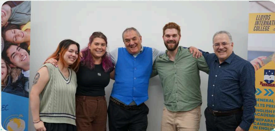
Some of our teachers! ※一部の先生たちです